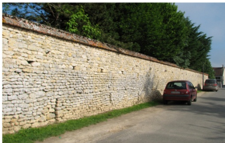
n°11 : mur de clôture de l'ancien prieuré