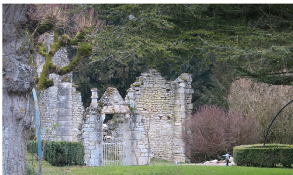
n°5 : site à la Villa «Normande»