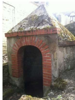
n°14 : Fontaine contrebas rue de la Porte