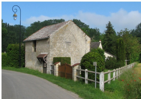
n°18 : Bâtiment le long de la rue du Marais à Châtillon