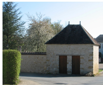
n°12 : Poste des Cheminots