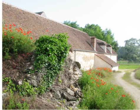
n°23 : Moulin de Châtillon- cave attenante aux bâtiments