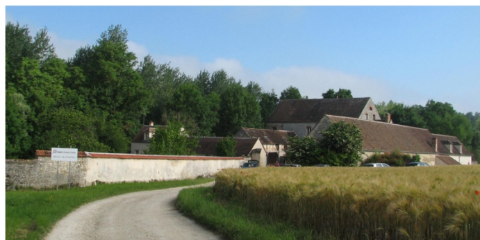
n°21 : mur de clôture