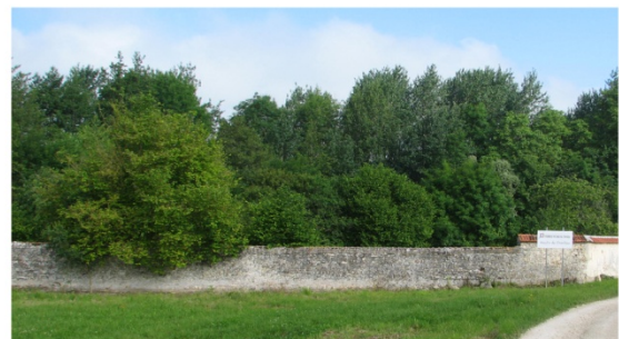
n°19 : Moulin de Châtillon - mur de clôture