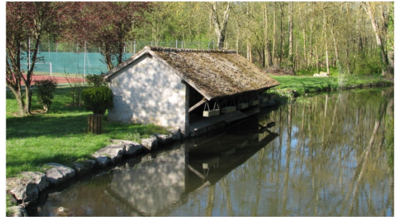
n°16 : Lavoir