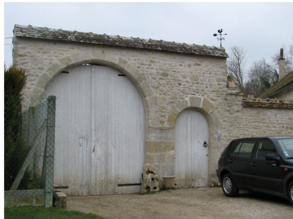
n°3 : Porche au numéro 38 Chemin du Moulin