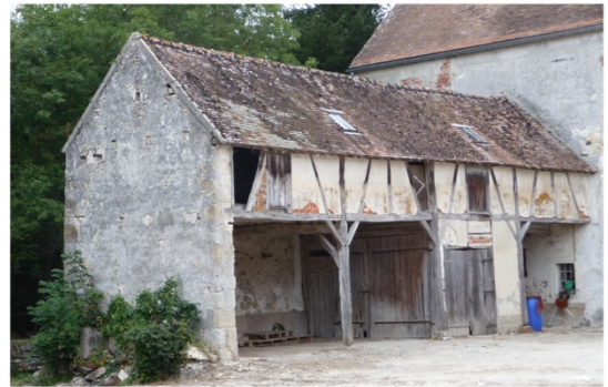
n°25 : Moulin de Châtillon bâtiment «Normand»