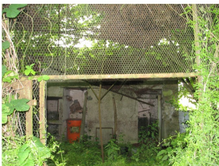
n°20 : ancienne volière