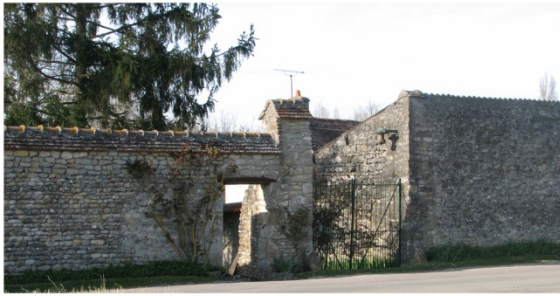
n°7 : Porte et mur de clôture