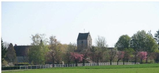
n°9 : Alignement d'arbres rue de la mairie-école