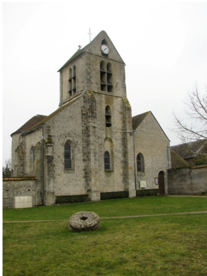
n° 13 : Eglise