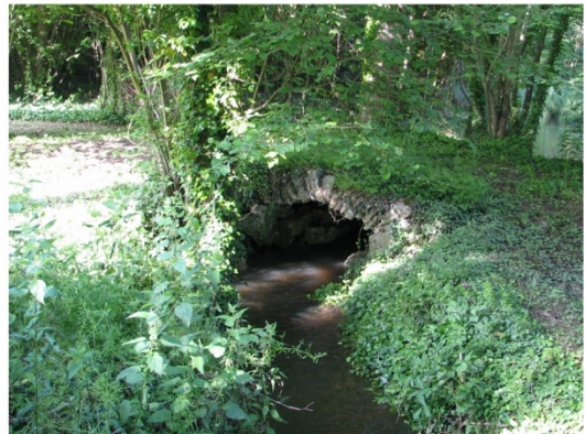
n°2 : Pont à la Groue