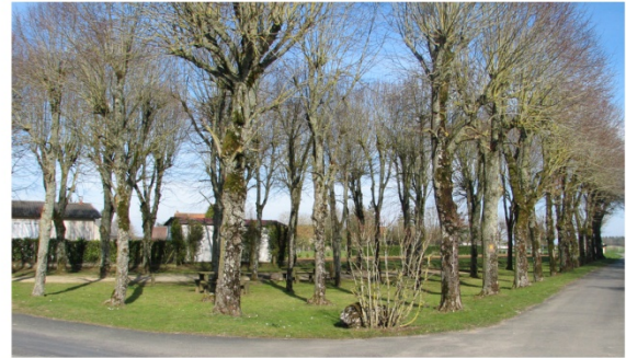
n°8 : Place des Tilleuls