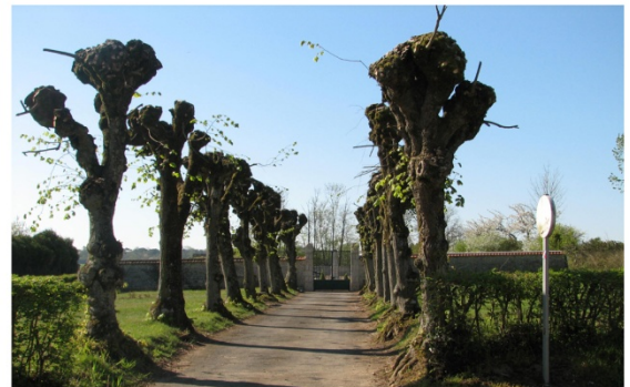
n°10 : Allée de Tilleuls