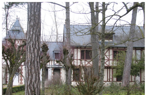
n°6: Villa «Normande»