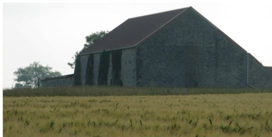
n°26 : Ferme fortifiée de Châtillon