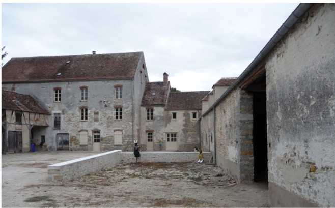
n°24 : Moulin de Châtillon- bâtiments nord et est