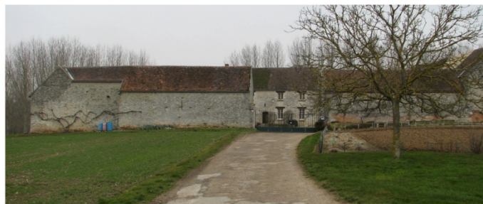
n°17 : Ferme à cour carrée des Plaines