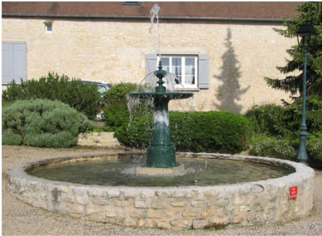
n°15 : Fontaine