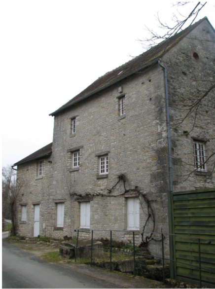
n°1 : Moulin de la Groue