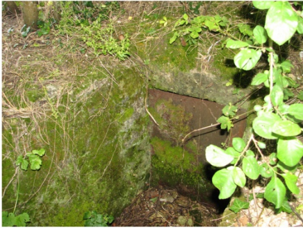
n°22 : Moulin de Châtillon- puits